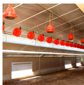
ISOLANTS DE TOITURE