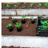
BACS DE PLANTATION