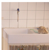
COLLES DE CARRELAGE