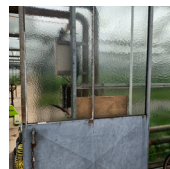
JOINTS DE VITRAGE