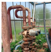
JOINTS DE BRIDE

VOICI QUELQUES MATÉRIEAUX POUVANT EN CONTENIR :